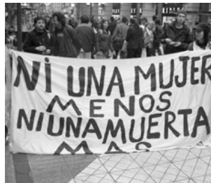
Una protesta en España, donde a partir de políticas activas del Estado se redujo la cantidad de femicidios, en el último año, a 73.