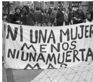
Una protesta en España, donde a partir de políticas activas del Estado se redujo la cantidad de femicidios, en el último año, a 73.